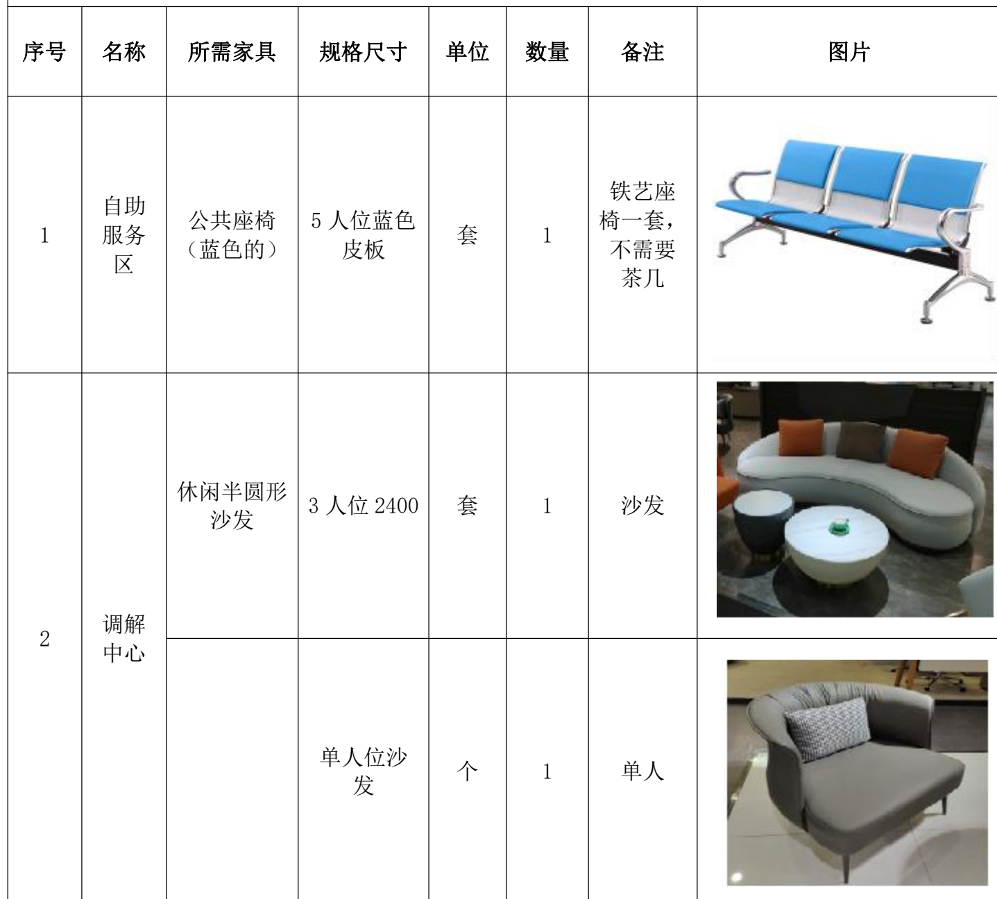
盐官警务站家具采购选款清单表