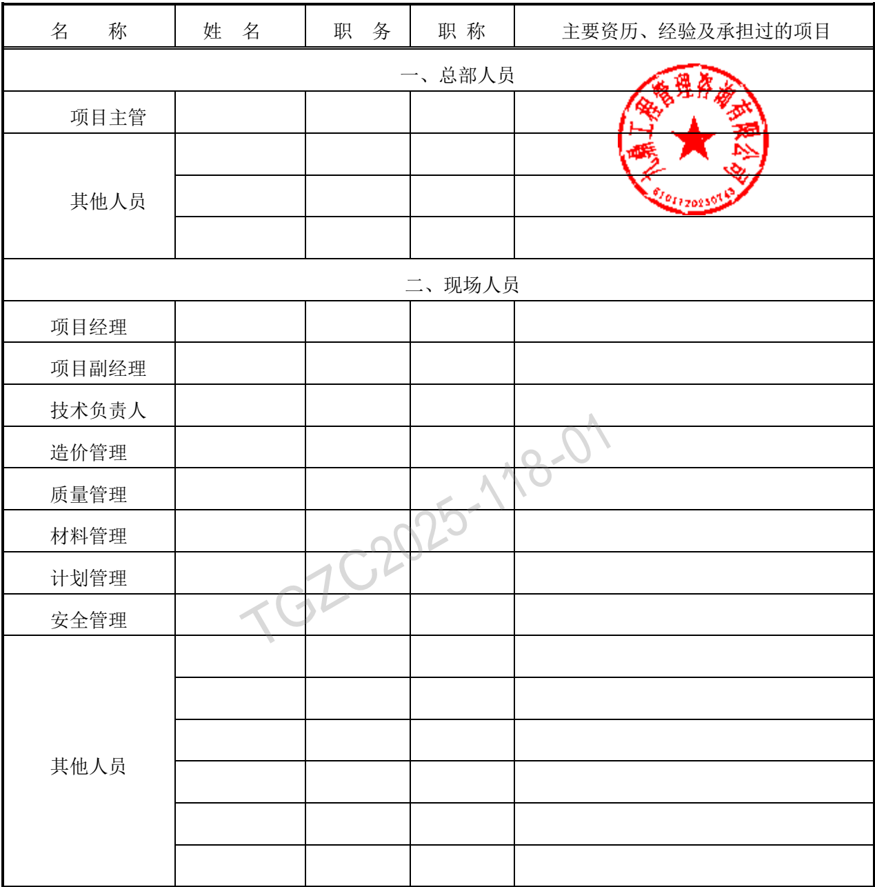
承包人主要施工管理人员表