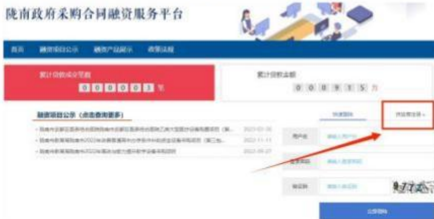
陇南政府采购合同融资服务平台

需要办理合同融资的供应商登录平台，已注册的输入“用户名”“密码”“验证码”登录（注意区分大小写），未注册的供应商点击“合同融资供应商注册”进行注册。