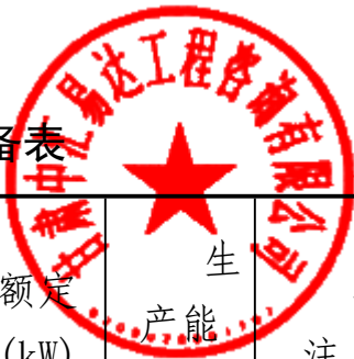
承包人用于本工程施工的机械设备表