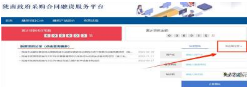
陇南政府采购合同融资服务平台

需要办理合同融资的供应商登录平台，已注册的输入“用户名”“密码”“验证码”登录（注意区分大小写），未注册的供应商点击“合同融资供应商注册”进行注册。