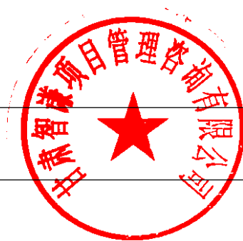
投标人基本情况表