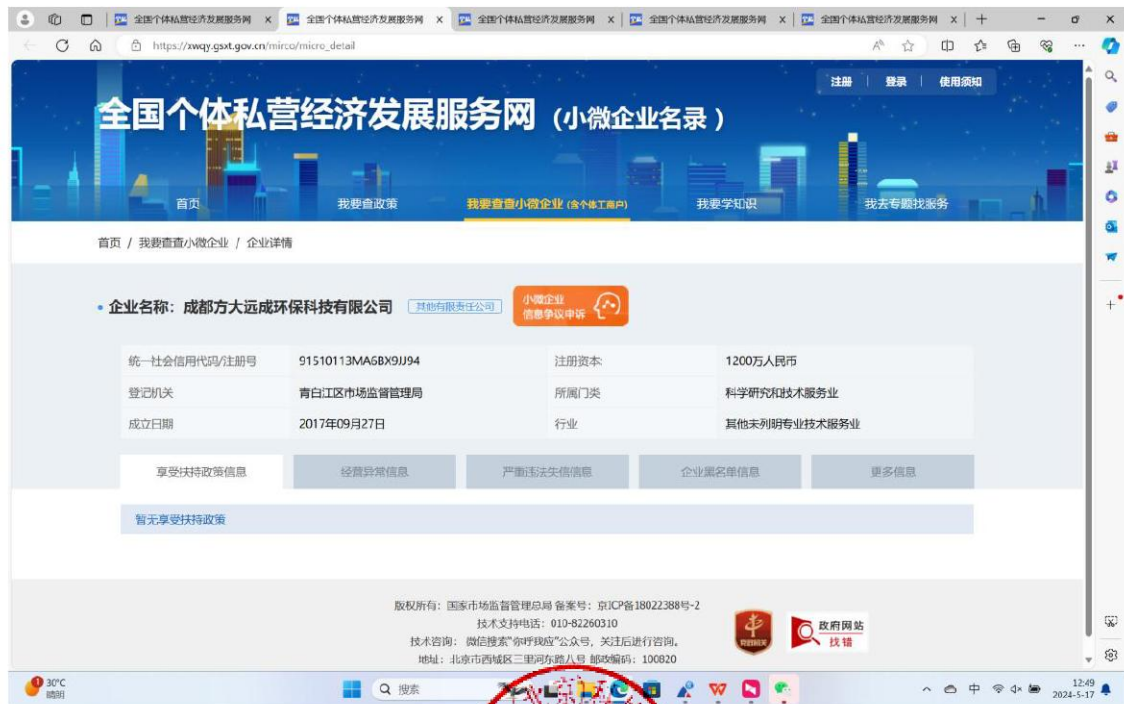
附：成都方大远成环保科技有限公司小微企业查询结果截图