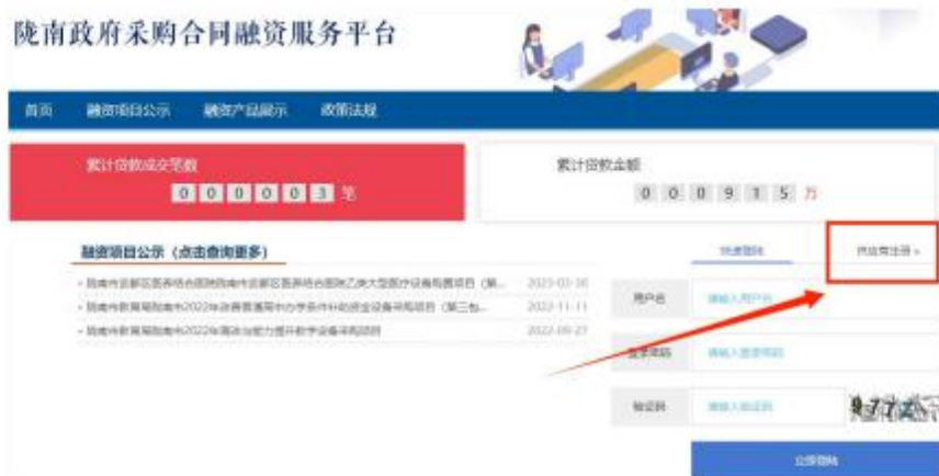
陇南政府采购合同融资服务平台

需要办理合同融资的供应商登录平台，已注册的输入“用户名”“密码”“验证码”登录（注意区分大小写），未注册的供应商点击“合同融资供应商注册”进行注册。