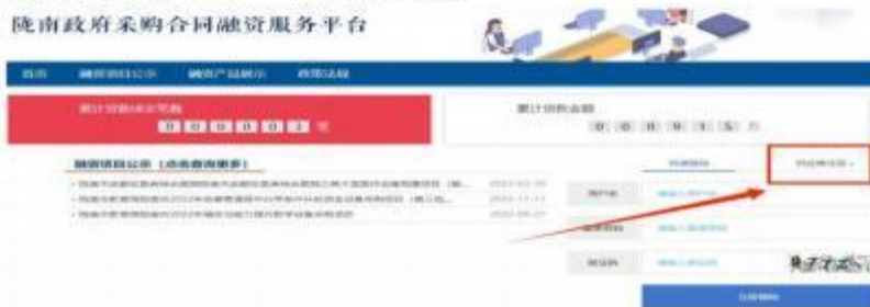
陇南政府采购合同融资服务平台

需要办理合同融资的供应商登录平台，已注册的输入“用户名”“密码”“验证码”登录（注意区分大小写），未注册的供应商点击“合同融资供应商注册”进行注册。